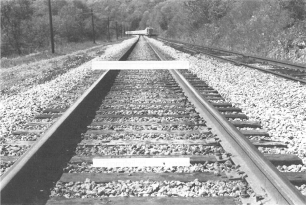
Рис. 1. Иллюзия Понцо [35, р. 1046]

ные иллюзии следует рассматривать как правило, а не как исключение» [43, р. 4]. Во-вторых, они подводят нас к мысли, что используемые поведенческими экономистами методы идентификации когнитивных искажений являются столь же точными и строго объективными, как и методы идентификации визуальных искажений (см. выше про измерения с помощью линейки). В-третьих, таким образом нам внушается идея, что окончательно отучиться от когнитивных ошибок невозможно — точно так же, как это невозможно в случае оптических иллюзий. Даже если сообщить человеку, что белые прямоугольники на рис. 1 имеют одинаковую длину, при повторном взгляде на них ему все равно будет казаться, что верхний длиннее нижнего. Если же ситуация с когнитивными ошибками выглядит симметричным образом, то это означает, что избавиться от них невозможно ни с помощью обучения, ни с помощью накопления практического опыта [7]. Для этого нужны принципиально иные методы, такие как политика «наджа», которые обращаются не к сознанию, а к подсознанию людей.