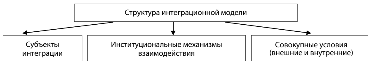
Рис. 1. Структура интеграционной модели

ночной экономикой ( nonmarket economy ), что определяет модель поведения экономических субъектов.