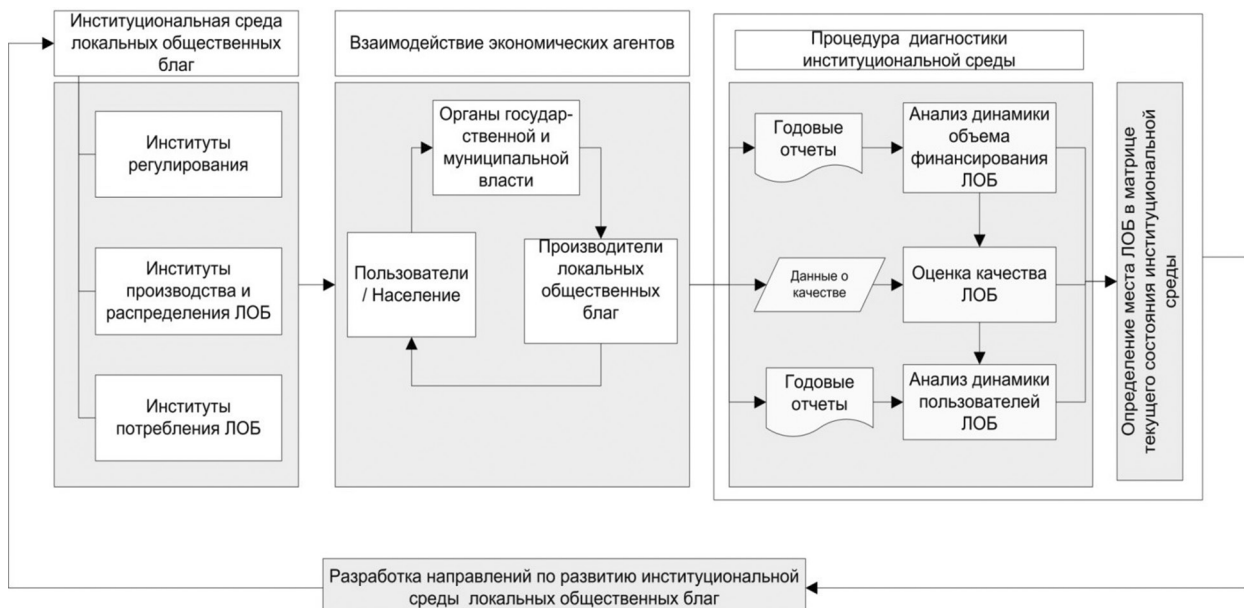
Рис. 1. Механизм диагностики институциональной среды локальных общественных благ (ЛОБ)

Процедура диагностики включает три этапа: 1) анализ динамики финансирования локальных общественных благ; 2) оценка качества локальных общественных благ; 3) анализ динамики пользователей локальными общественными благами. Нормы и правила,