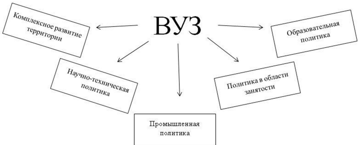
Рис. 1. Факторы взаимодействия вуза и малого города

деятельности, но она является производной от других важных функций университета. На наш взгляд, это еще раз подтверждает, что особая актуальность «третьей функции» отведена вузам в малых и средних городах.