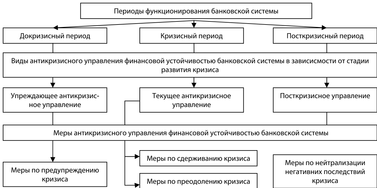
Рис. 2. Схема взаимодействия видов (по периодам) антикризисного управления с мерами антикризисного управления финансовой устойчивостью банковской системы (разработано автором)

никает необходимость создания структурного подразделения Национального банка Украины, который бы занимался микро- и макропруденциальным анализом банков и банковской системы в целом в пределах пруденциального (микро- и