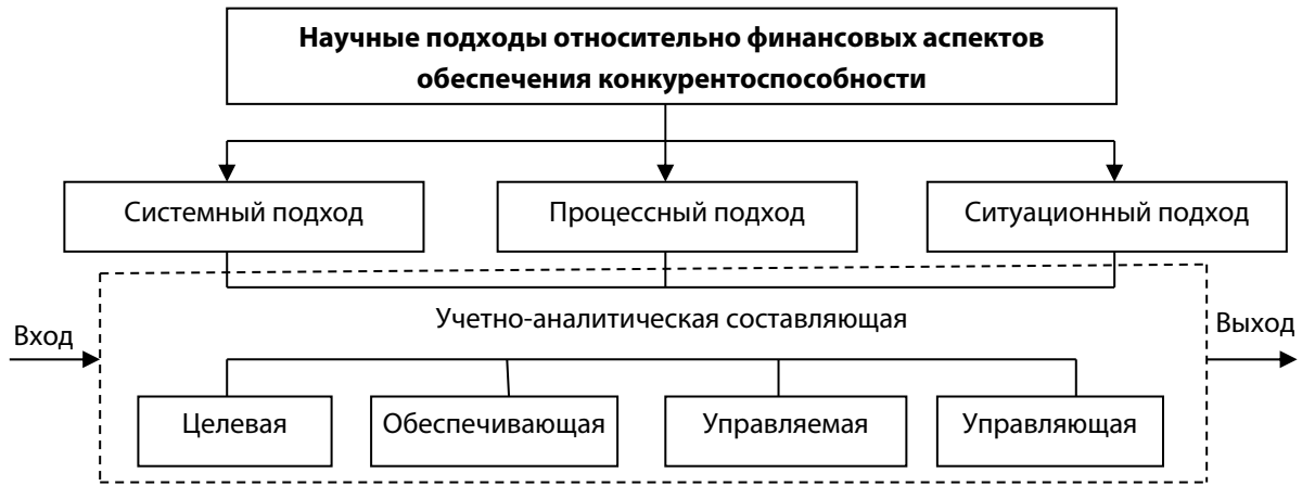
Рис. 3. Концептуальное обоснование финансового аспекта обеспечения конкурентоспособности (составлено авторами)

нансово-хозяйственной деятельности; 5) организации системы планирования и разработки плановых показателей; 6) использования системы мотивации (стимулирования), при условии положительных динамических сдвигов стратегического развития; 7) организации эффективного контроля при условии создания системы контролируемых критериев и показателей стратегического развития, выявления отклонений и факторов, влияющих на изменение (положительное или отрицательное).