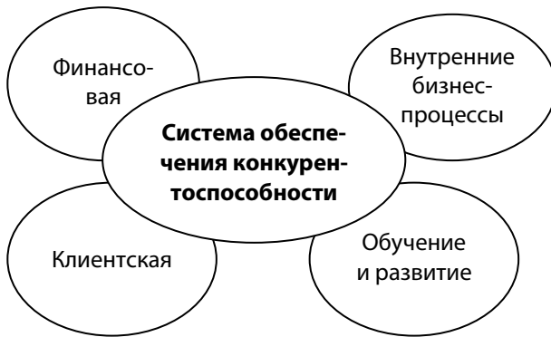
Рис. 2. Критериальные составляющие обеспечения конкурентоспособности экономического субъекта

перспектив экономического субъекта исходя из финансовых целей деятельности, которые определяются интересами собственников бизнеса — «...максимизацией благосостояния собственников предприятия в текущем и перспективном периоде, обеспечиваемой путем максимизации его рыночной стоимости» (Бланк, 2004. С. 37).