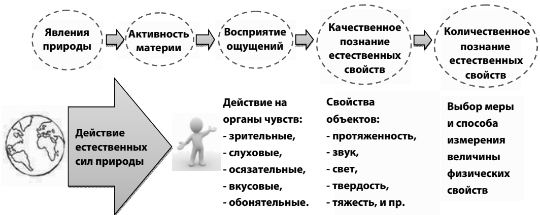
Рис. 1. Модель естественнонаучного познания человеком естественных явлений природы.