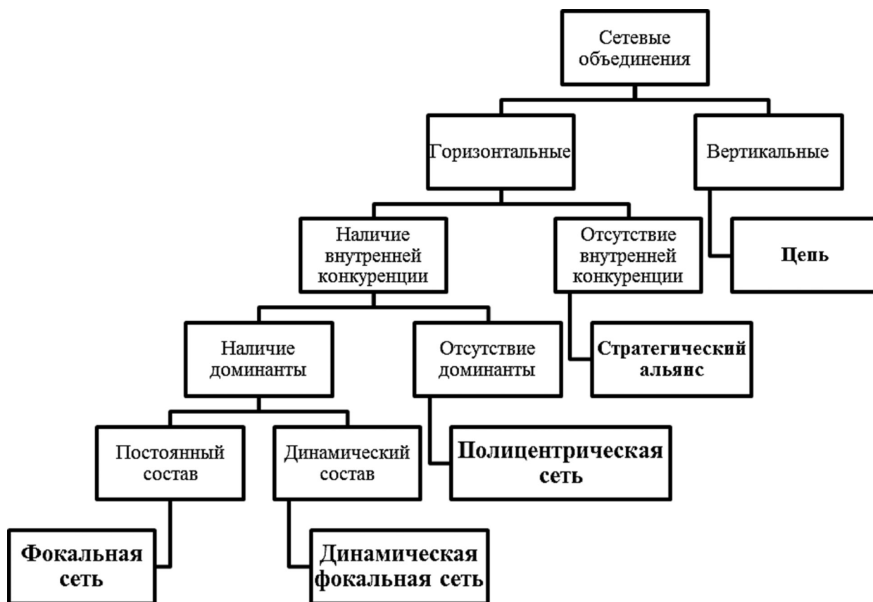
Рис. 2. Типология сетевых партнерств.

ний по регистрации патентных прав). Таким образом, мы можем выделить следующие типы транзакционных издержек: