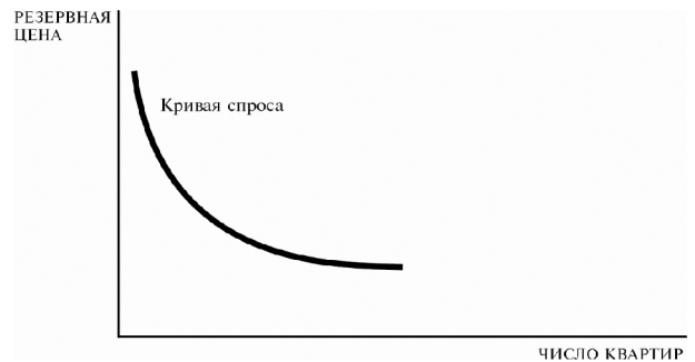
Рис. 4. Кривая спроса на квартиры при наличии большого числа лиц, предъявляющих спрос

структуры хозяйственных явлений. Например, выдающийся американский экономист и автор одного из наиболее распространенных учебников микроэкономики промежуточного уровня Х.Р. Вэриан утверждает: «...При любых попытках объяснения поведения людей необходимо иметь некую структуру, выступающую в качестве основы проводимого анализа» [3, с. 17]. С этим следует согласиться. Структура определяется пространственными факторами, принимающими характер экзогенной и эндогенной переменных. Соответственно, структурируется кривая спроса (рис. 3) [3, с. 19].