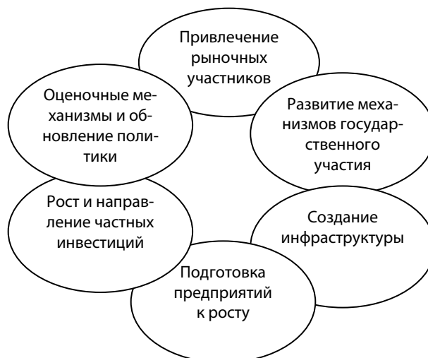
Рис. 2. Шесть шагов к поддержке социальных инноваций [8]

5. Рост и направление частных инвестиций. Капитал является краеугольным камнем в отношении развития социальных инноваций.