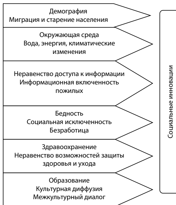
Рис. 1. Актуальные сферы применения социальных инноваций

В целом комплекс проблем, с которыми сталкивается современная экономика в отношении развития общественного сектора и в отношении которых формируется острая необходимость применения социальных инноваций, представлен на рисунке 1.